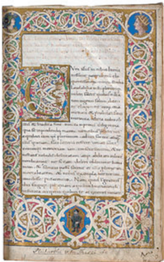
Pagine di codici miniati nel Sec. XII